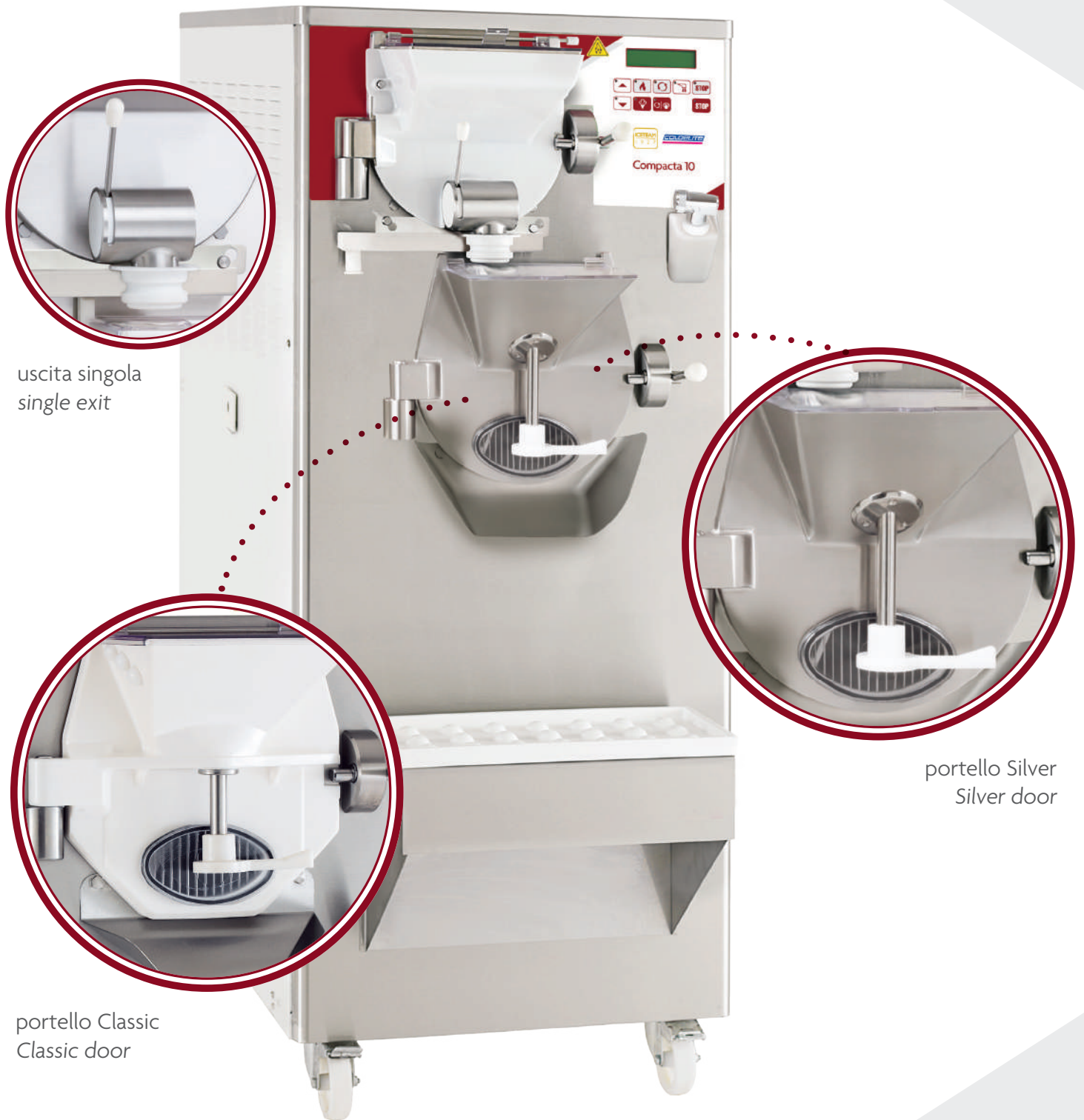
uscita singola single exit